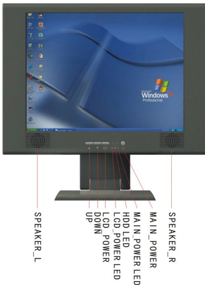
Gambar 1. Tampak depan dari 14"