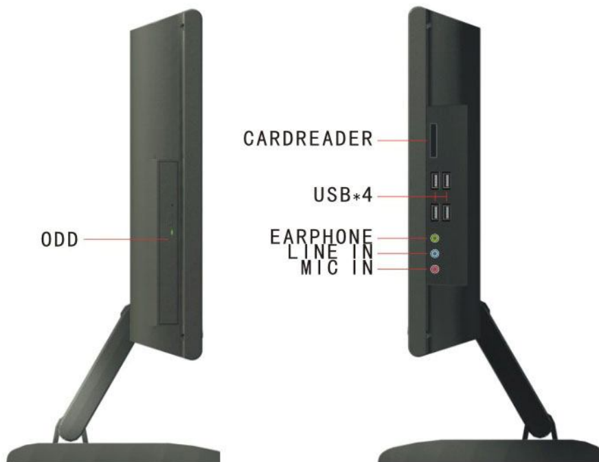
Gambar 1. Tampak samping dari 15.4" /17"