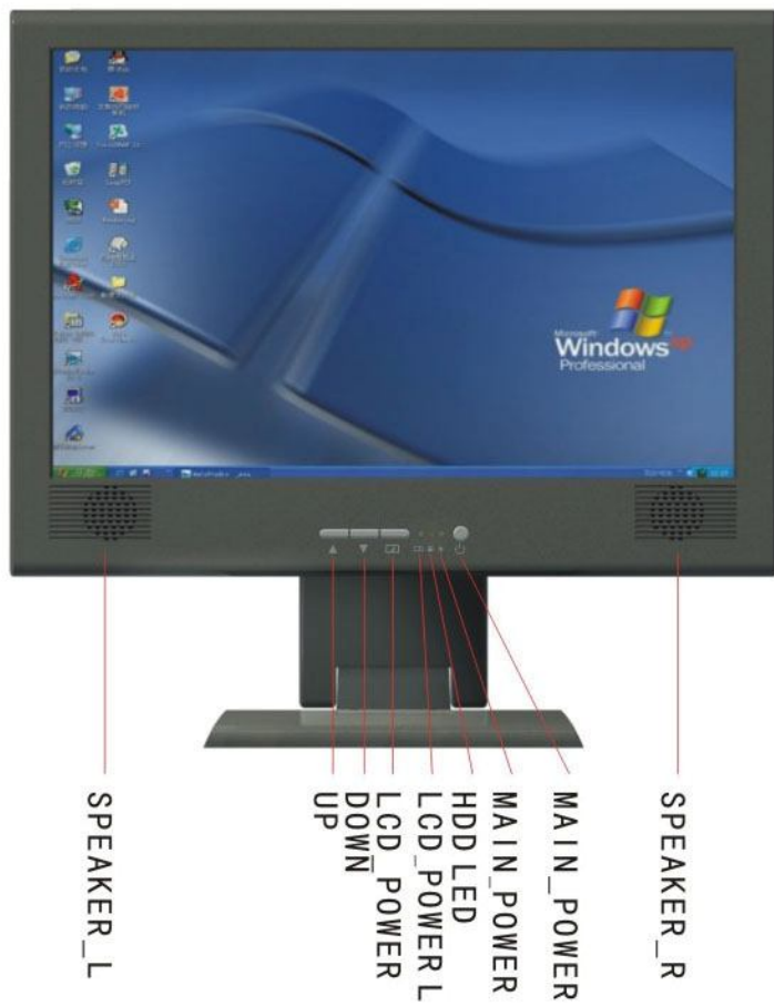
Gambar 3 Tampak depan dari 15.4"/17"