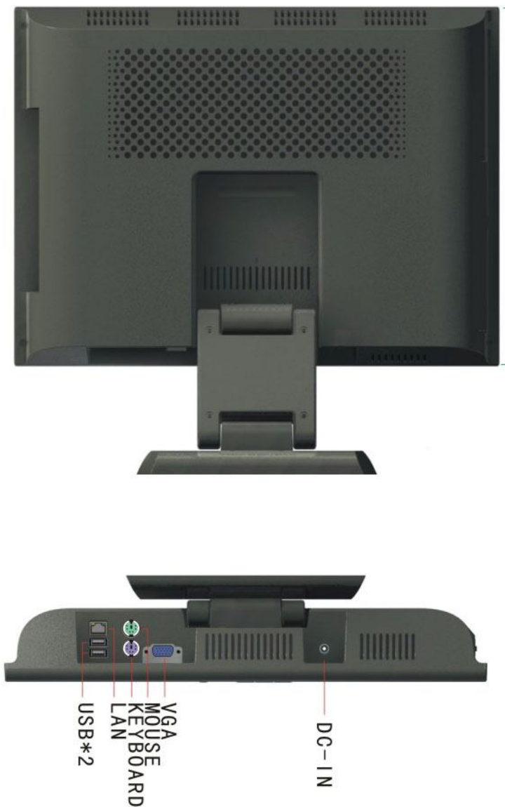
Gambar 2. Tampak Belakang