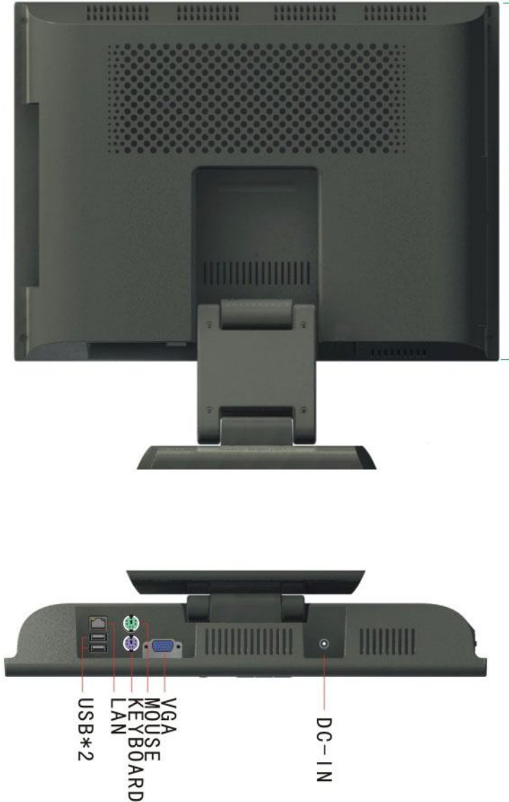
Gambar 2. Tampak Belakang