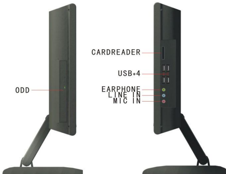
Gambar 1. Tampak samping dari 15.4" /17"